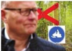
Skoterlederna ska dras om så att de inte längre går över några spår.