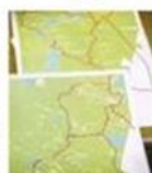
Hösten 2020 ska hela ledsystemet vara klart.